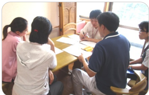
▶竹友ケアマネ サ担の様子